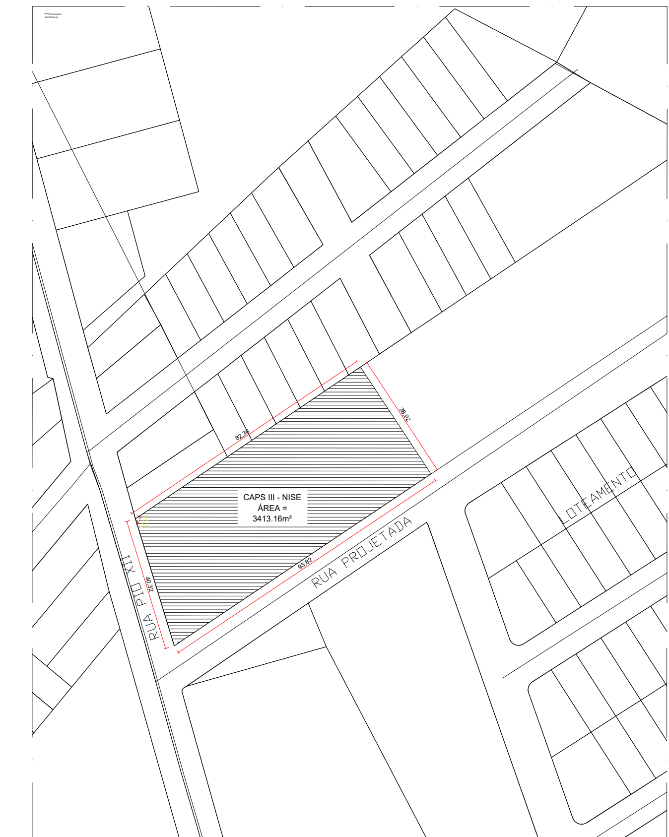
01 PLANTA DE SITUAÇÃO ESCALA: 1/100